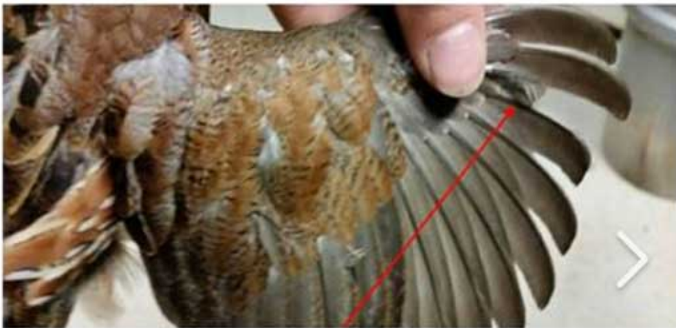
هشتمین پر به صورت نصف رشد کرده است. سن 119 روز

هم چنین در تصویر زیر بال های یک بلدرچین 120 روزه را مشاهده می کنید که شاه پر هشتم پرنده با بال اولیه هشتم در حال جایگزینی می باشد.