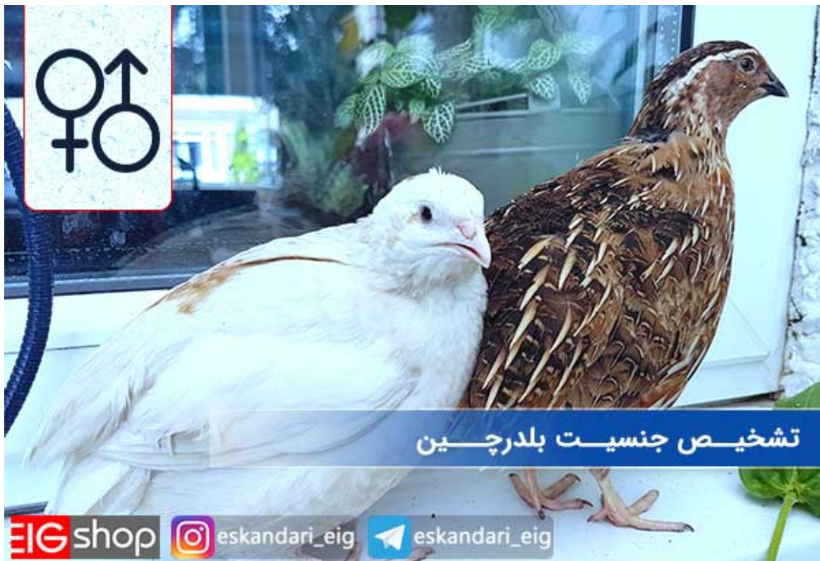
تشخیص جنسیت بلدرچین

تکنیک های تشخیص جنسیت بلدرچین : بلدرچین پرنده ای سریع الرشد می باشد و در 40 الی 50 روز کاملاً بالغ خواهد شد و آماده جفت گیری و تخم گذاری می شود که دوره بازگشت سرمایه را کاهش داده و در بازه زمانی بسیار کوتاهی سرمایه پرورش دهنده را چند برابر خواهد کرد. اما برای اینکه بتوانید پرورش دهنده موفق در این زمینه باشید باید به صورت حرفه ای قادر به تشخیص سن و جنسیت این پرنده پر خاصیت و سود آور باشید، در این نوشته تکنیک ها و روش هایی کاملاً کاربردی و ساده خدمتان ارائه خواهیم داد که به واسطه آنها به راحتی قادر به تشخیص سن و جنسیت بلدرچین ها خواهید شد، با ادامه مطلب همراه باشید.