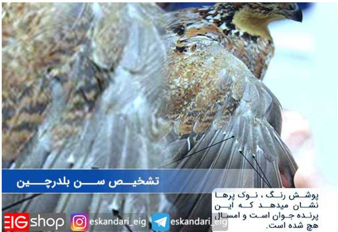
تشخیص سن بلدرچین

در ادامه تصویری از یک بلدرچین جوان را مشاهده خواهید کرد که پر های اولیه او در حال رشد بوده و در آینده با شاه پر های او جایگزین خواهد شد.