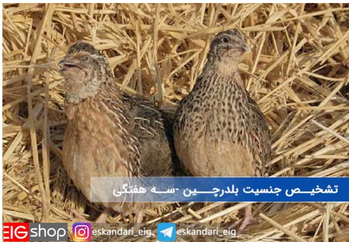
تشخیص جنسیت بلدرچین سه هفتگی

تشخیص جنسیت در بلدرچین ها و تمایز بلدرچین نر و ماده از یکدیگر نیز به سادگی امکان پذیر خواهد بود، برای این منظور باید تا سه هفتگی آنها صبر کنید، زیرا جوجه بلدرچین ها بسیار شبیه به یکدیگر بوده و نقاط تمایز جنس نر و ماده از سه هفتگی به بعد ظاهر خواهند شد. در تصویر زیر یک جفت بلدرچین نر و ماده را مشاهده می کنید.