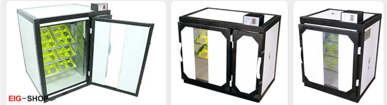
دستگاه جوجه کشی شترمرغی اسکندری

این گروه صنعتی چند سالی می شود که تولید دستگاه های جوجه کشی شترمرغی را نیز در دستور کار خود قرار داده اند، ولی کیفیت این دستگاه ها کمتر از نیک هنگام و توسن می باشد. اما با این وجود به دلیل استفاده از سنسور پیشرفته SHT، هوش مصنوعی کنترل دقیق دما و رطوبت، سیستم رطوبت گیری دوران هچر و رطوبت دهی دوران ستر باعث کارایی خوب این دستگاه شده و نظرات مشتریان اغلب مثبت بوده است و با توجه به اینکه قیمت ارزان تری نسبت به نیک هنگام و توسن دارد، از کیفیت خوبی برخوردار است.