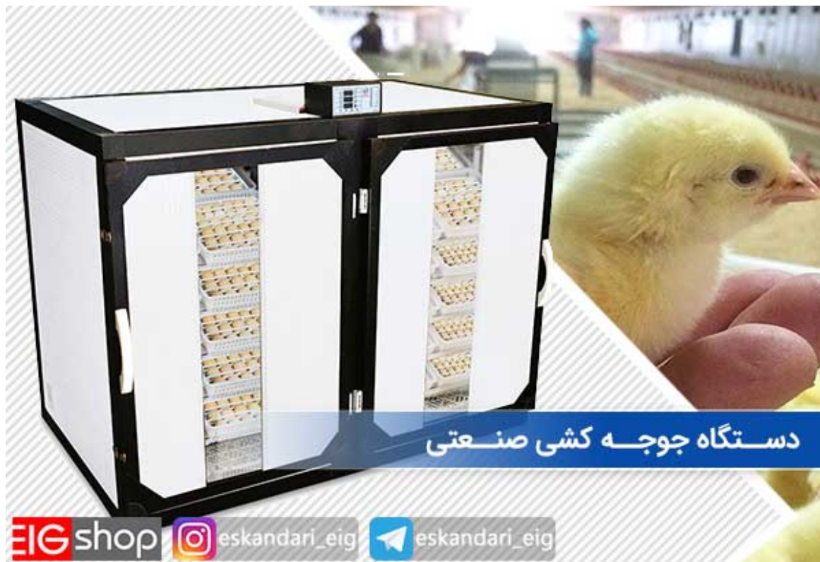
دستگاه جوجه کشی صنعتی

شانه های این دستگاه ها نیز به صورت همه کاره بوده که امکان جوجه کشی از تخم های مختلف را به صورت همزمان فراهم می کند و هنگام رسیدن دوران هچر نیز به عنوان سبد هچر قابل استفاده است. بدنه PVC نیز میزان هدر رفت دما و رطوبت درون دستگاه را به صورت قابل توجهی کاهش داده و به علاوه از رشد عوامل بیماری زا مانند انواع قارچ ها و باکتری ها در درون دستگاه جلوگیری می نماید و دستگاه را کاملاً قابل شستشو می کند، ورق دوجداره PVC هیچگاه زنگ نمی زند و وزن دستگاه را نیز افزایش نمی دهد.