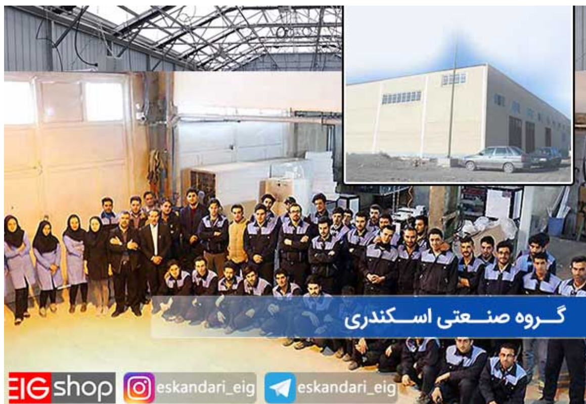
دستگاه جوجه کشی اسکندری

دستگاه جوجه کشی اسکندری : اگر مطالب ای آی جی شاپ را دنبال کرده باشید ، در مسیری یک به یک به بررسی محصولات تولید کنندگان و فروشندگان مطرح جوجه کشی در کشور پرداخته ایم. اگر با این موضوع آشنایی ندارید می توانید به صفحه بررسی دستگاه جوجه کشی مراجعه کنید. در ادامه مسیر بررسی دستگاه های جوجه کشی پس از بررسی دستگاه جوجه کشی بلدرچین دماوند ، دستگاه جوجه کشی فاخته ، دستگاه جوجه کشی دی کیو شاپ نوبت به بررسی دستگاه جوجه کشی اسکندری می رسد، در این نوشته از وب سایت ای آی جی شاپ ( EIG-SHOP ) می خواهیم شما را به صورت کاملا ساده و واضح با خصوصیات، مزایا و معایب دستگاه جوجه کشی تولیدی این گروه صنعتی آشنا سازیم.