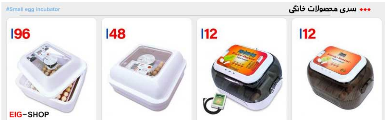
سری محصولات خانگی اسکندری

محصولات تولیدی گروه صنعتی اسکندری هم اکنون در دو گروه صنعتی و خانگی تولید می شود. از محصولات دستگاه جوجه کشی اسکندری ، ماشین های جوجه کشی خانگی با نام ایزی باتور شناخته شده است و شامل دستگاه های جوجه کشی ایزی باتور 1 ، ایزی باتور 2 ، ایزی باتور 3 ، ایزی باتور 4 ، ایزی باتور 5 و ایزی باتور 6 می شود. ایزی باتور 1 در سال 1393 ، ایزی باتور 2 در سال 1394 ، ایزی باتور 3 و 5 در سال 1395 و ایزی باتور 4 و 6 نیز در سال 1396 وارد بازار شد. علت اینکه دستگاه ایزی باتور 3 و 4 دیر به بازار عرضه شد طبق گفته های خود تولید کننده طراحی شانه های غلتکی آن بوده است. همچنین طبق تبلیغاتی که این گروه صنعتی نموده قرار بر این شد تا ایزی باتور های 7 ، 8 ، 9 و 10 را تا اواخر سال 1397 وارد بازار نماید ولی هنوز خبری نیست و می توان گفت که نوسانات ارز و عدم ثبات بازار در این اواخر تاثیر زیادی در روند تولید این گروه صنعتی داشته است.