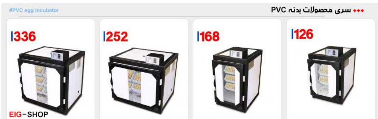
سری محصولات بدنه PVC

محصولات تولیدی گروه صنعتی اسکندری هم اکنون در دو گروه صنعتی و خانگی تولید می شود. از محصولات دستگاه جوجه کشی اسکندری ، ماشین های جوجه کشی خانگی با نام ایزی باتور شناخته شده است و شامل دستگاه های جوجه کشی ایزی باتور 1 ، ایزی باتور 2 ، ایزی باتور 3 ، ایزی باتور 4 ، ایزی باتور 5 و ایزی باتور 6 می شود. ایزی باتور 1 در سال 1393 ، ایزی باتور 2 در سال 1394 ، ایزی باتور 3 و 5 در سال 1395 و ایزی باتور 4 و 6 نیز در سال 1396 وارد بازار شد. علت اینکه دستگاه ایزی باتور 3 و 4 دیر به بازار عرضه شد طبق گفته های خود تولید کننده طراحی شانه های غلتکی آن بوده است. همچنین طبق تبلیغاتی که این گروه صنعتی نموده قرار بر این شد تا ایزی باتور های 7 ، 8 ، 9 و 10 را تا اواخر سال 1397 وارد بازار نماید ولی هنوز خبری نیست و می توان گفت که نوسانات ارز و عدم ثبات بازار در این اواخر تاثیر زیادی در روند تولید این گروه صنعتی داشته است.