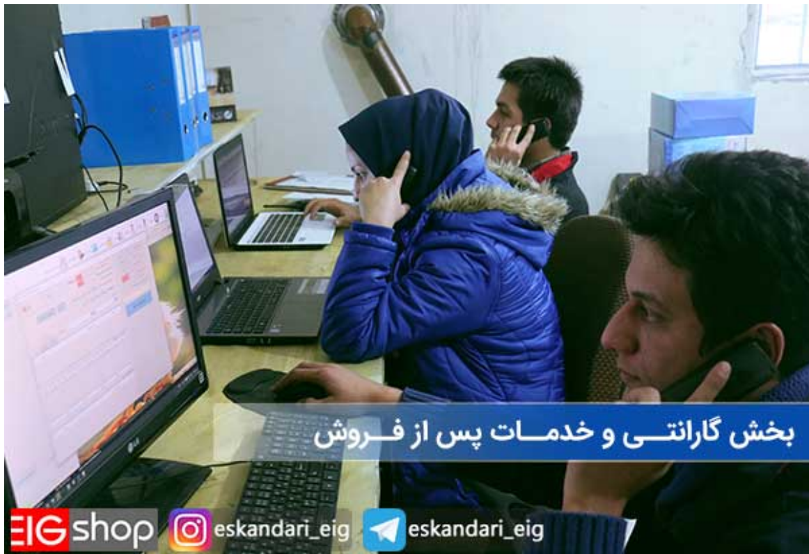
بخش گارانتی و خدمات پس از فروش

بدون اغراق می توان گفت که گروه صنعتی اسکندری اولین کمپانی است که دارای بخش مستقل گارانتی و خدمات پس از فروش می باشد و ماشین جوجه کشی اسکندری جزء محصولات است که واحد و پرسنلی مجزاء مسئول رسیدگی به مشتریان می باشند. این بخش دارای پرسنل مستقل، امکانات مجزا و نرم افزار های پیشرفته جهت رسیدگی سریع به سوالات و مشکلات کاربران می باشد و گارانتی ارائه شده توسط این قسمت پشتیبانی می شود و خدمات پس از فروش دستگاه ها را نیز خود این بخش یا نمایندگان آنها در سراسر کشور بر عهده می گیرند، همچنین لازم به ذکر است که تمامی دستگاه های تولید شده توسط گروه صنعتی اسکندری دارای 1 سال گارانتی و 10 سال خدمات پس از فروش می باشد.