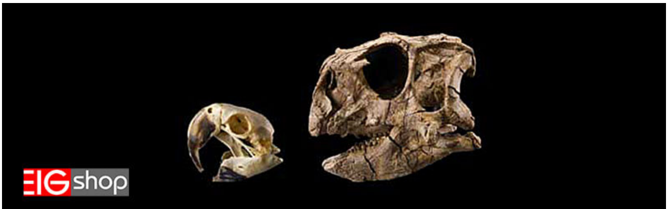
اسکلت طوطی هلندی و دایناسور

اولین شواهد از کشف فسیل های شبیه به عروس هلندی ها در سال ۲۰۰۱ پدیدار شد، در این سال دانشمندان اعلام کردند که یک فسیل ۱۳۰ میلیون ساله از یک دایناسور پردار در چین کشف شده است. در واقع می توان گفت که این اولین دایناسوری بود که با پوشش از پر کشف شده است. این دایناسور کوچک و تیز پا دارای پنجه هایی ناقص روی انگشت وسطی و ساختارهایی محکم در دم بود. فسیل مربوطه در استان لیائونینگ در بخش شمالی چین یافت شد. در توصیف این فسیل گفته شده که شبیه یک اردک بزرگ با دم بلند است. سر و دم این جانور با الیاف ظریفی پوشیده شده بود و در قسمت پشت دست و دیگر بخشهای بدنش نیز، ساختارهای پرمانندی دیده می شد.