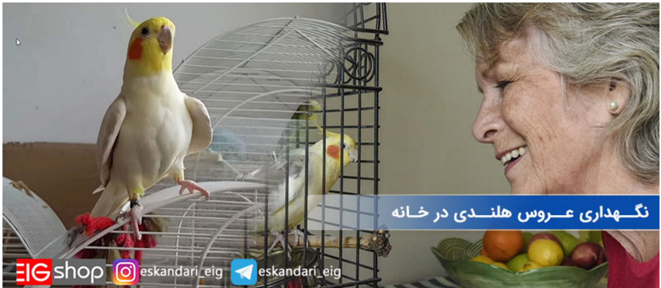
نگهداری عروس هلندی در خانه

نکات زیر را هرگز دست کم نگیرید و اگر قصد نگهداری این پرنده را دارید حتما موارد اشاره شده را مد نظر قرار دهید :