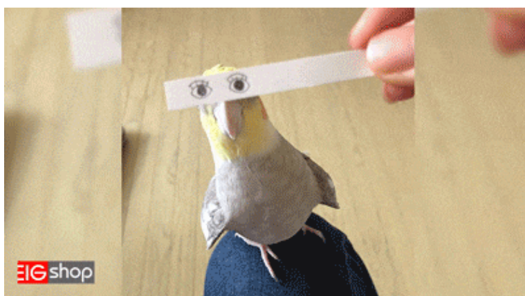
عکس های خنده دار عروس هلندی

اگر واقعاً قصدتان پرورش و نگهداری عروس هلندی در خانه است، پس بهتر است قبل از شروع به خرید این پرنده سوال هایی را از خود بپرسید. آیا به پرنده ها علاقه دارید؟ آیا زمانی کافی برای نگهداری و رسیدگی به آنها دارید؟ آیا در خانه شما مکان امن و مناسبی برای این پرنده وجود دارد؟ آیا می توانید فضولات و کثیفی های پرنده را تحمل کنید؟ آیا توانایی تحمل بوی خاص آنها را دارید؟ آیا قادر به تحمل