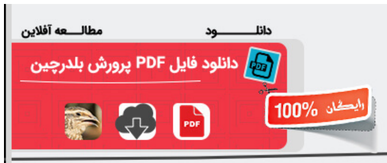
دانلود فایل PDF پرورش بلدرچین