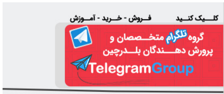
گروه پرورش دهندگان بلدرچین