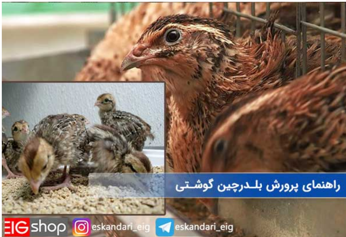
راهنمای پرورش بلدرچین گوشتی

در این مدل از کسب و کار هدف پرورش دهنگان بیشتر پروار کردن بلدرچین ها می باشد تا گرفتن تخم از آنها، البته هستند کسانی که هم بلدرچین ها را پروری می کنند و هم از آنها تخم می گیرد. در این صورت قضیه کمی پیچیده خواهد بود، چون برای این منظور باید از قفس های مکانیزه استفاده کنید. و باید الزاما نژاد های تخم گذار را پروری کنید. مانند نژاد ژاپنی و نژاد معمولی. ولی اگر فقط قصد گوشتی کردن آنها را دارید و قصد کسب درآمد آنچنانی از تخم آنها را ندارید، نژاد سینه سفید هندی و نژاد سفید آمریکایی مناسب می باشد. در این روش نیازی به خریداری قفس هم نیست.