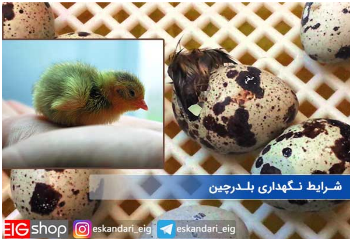
شرایط نگهداری بلدرچین

جوجه ها بسیار حساس و مستعد بیماری هستند، در این دوره باید آنها را تحت شرایط خاصی و داخل یک اتاق پرورش دهید.