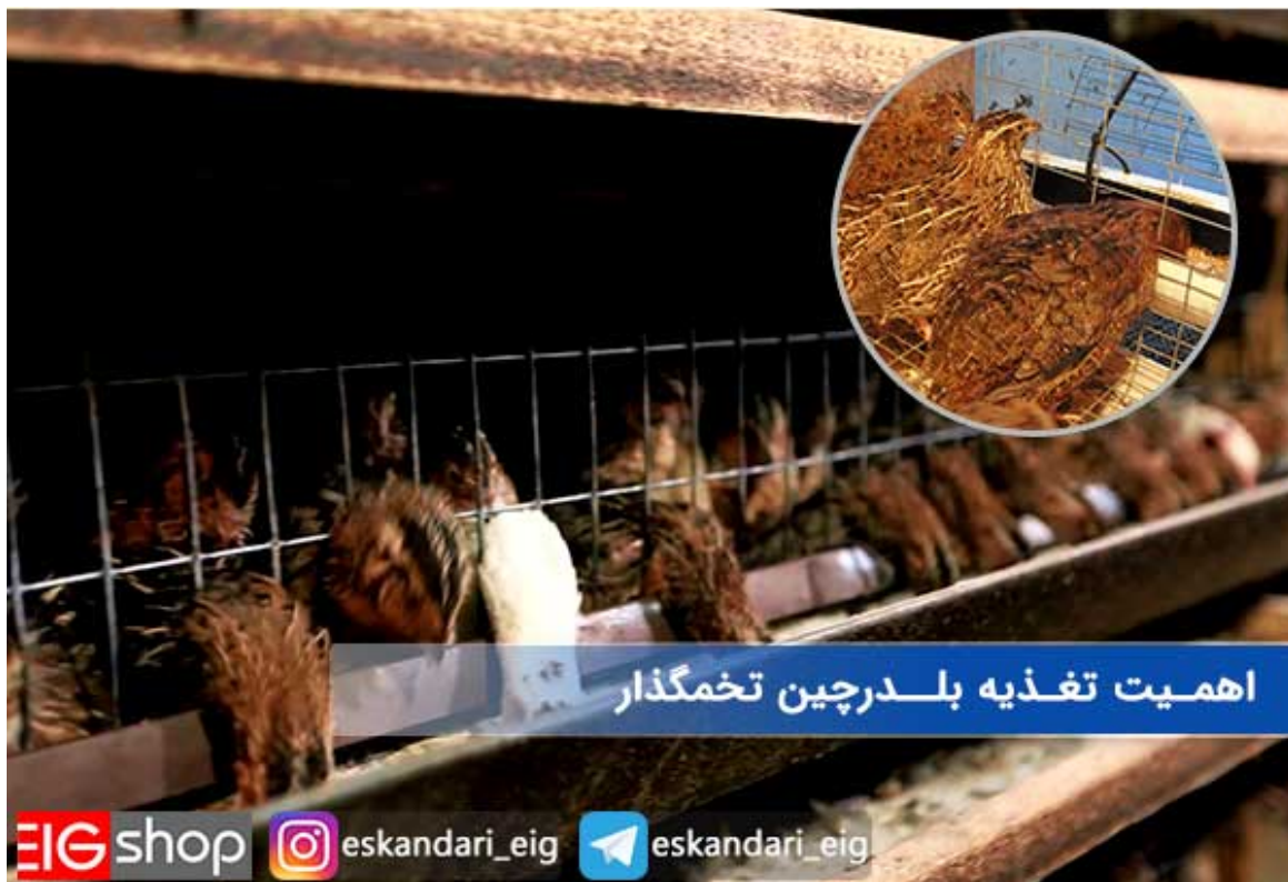
اهمیت تغذیه بلدرچین تخمگذار

کیفیت تغذیه پرنده بر میزان تخم گذاری او تاثیر بسزایی دارد، سعی کنید غذای بلدرچین ها را از مراکز معتبر تهیه کنید. تا از کیفیت آن مطمئن باشید. دان های مصرفی بلدرچین را خودتان نیز میتوانید تهیه کنید البته این کار نیاز به تخصص دارد، اگر متخصص آشنا دارید می توانید فرمولاسیون دان بلدرچین را از او تهیه نمایید.