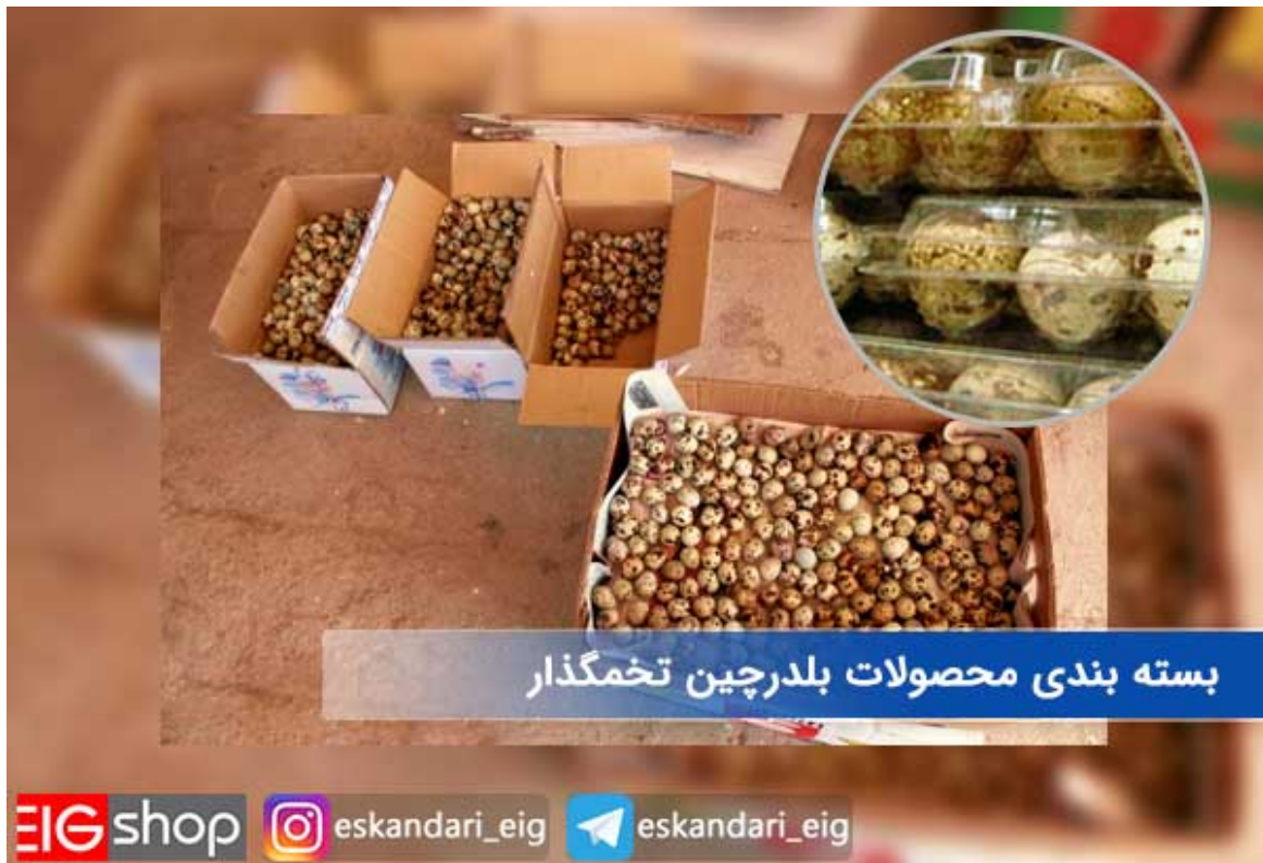
بسته بندی محصولات بلدرچین تخمگذار

بسته محصول فرایند نهایی هر واحد تولیدی و مهم ترین مرحله در هر واحدی می باشد. چون بسته بندی یک محصول تاثیر بسزایی در فروش آن دارد. کیفیت بسته بندی محصول شما به مشتری می فهماند که شما چقدر برای محصول خودتان و مشتری ارزش قائل هستید، شاید بارها با موارد این چنینی برخورد داشته اید. در بسته بندی محصول موارد زیر را رعایت کنید :