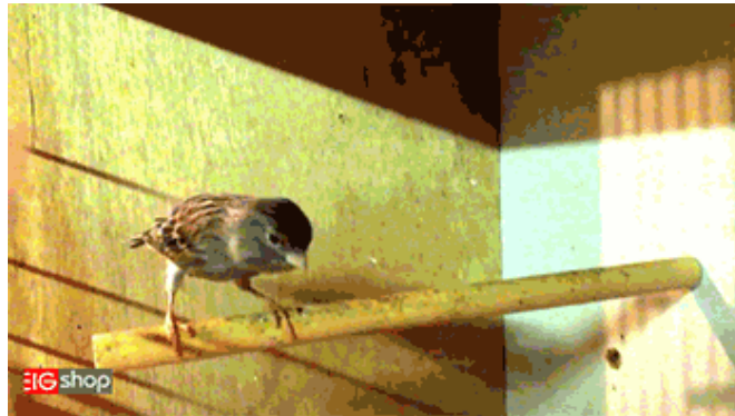
جفت گیری قناری

پس اگر محیط قناری ها گرم باشد و از رژیم غذایی مقوی و گرم بهره مند شوند و قناری ماده از وجود لانه و آرامش لازم در محیط مطمئن شود، بدین ترتیب باید کم کم منتظر جفت گیری آنها بود، وجود نشانه های زیر در قناری ماده و نر نشان از مست بودن آنها بوده که برای جفت گیری نیز آماده هستند.