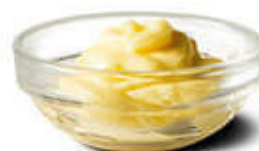
دستگاه کره گیر و دوغ ساز