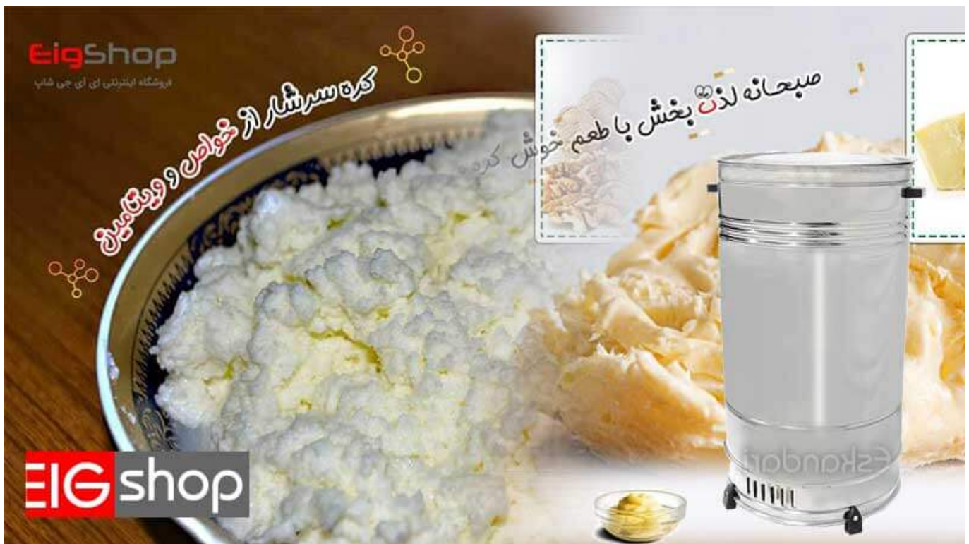
کره گیر چیست

برای پاسخ کره گیر چیست بایست گفت به دستگای گفته می شود که با استفاده از نیروی گریز از مرکز چربی موجود در ماست یا شیر را میگیرد. کره گیر ها در اندازه ها و انواع مختلفی تولید می شوند که برخی از آنها برای استفاده در خانه، برخی از آنها برای استفاده در مغازه و برخی نیز برای استفاده در کارگاه های تولیدی کوچک و بزرگ کاربرد دارند و این موارد انواع کره گیر را شکل میدهد. این محصولات در دو نوع کره گیر بالازن و کره گیر پایین زن به بازار عرضه شده اند.