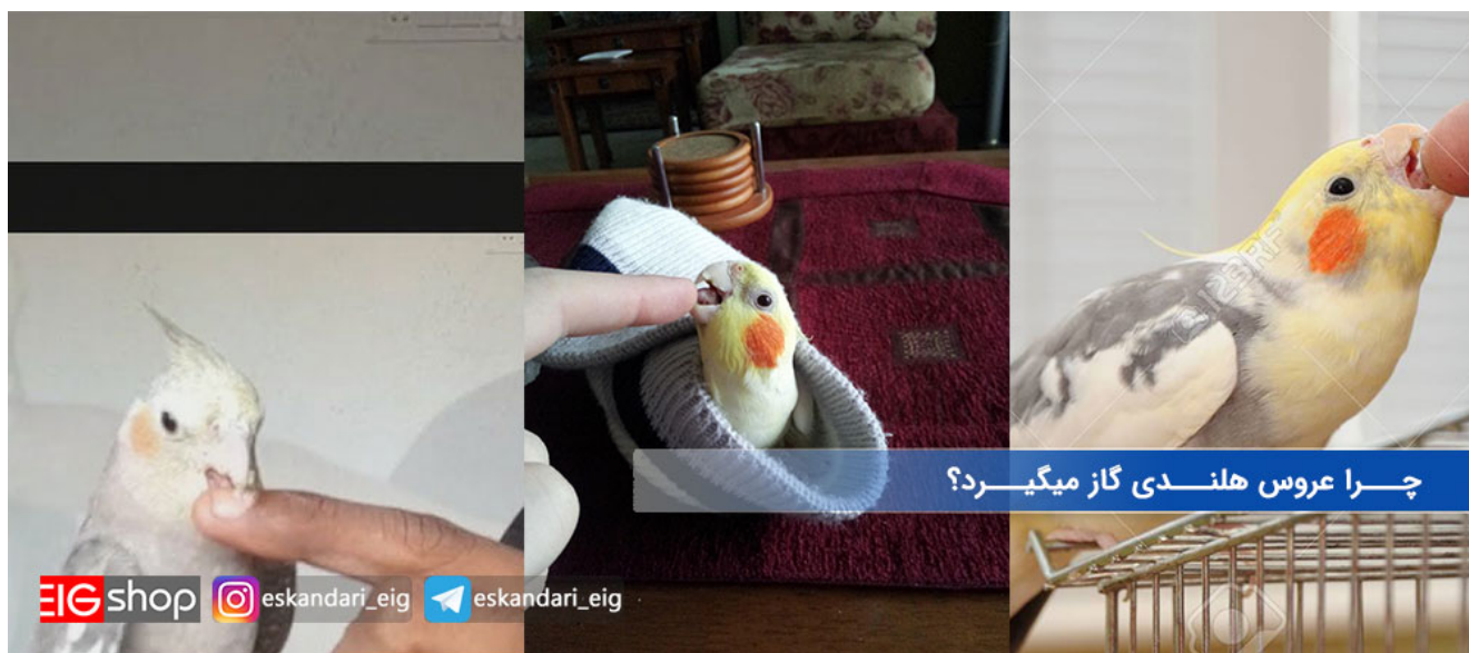
گاز گرفتن عروس هلندی

زمانی که عروس هلندی تان را تازه خریده باشید و هنوز به شما عادت نکرده باشد، ممکن است برای دفاع از خود و دور کردن شما، انگشت تان را گاز بگیرد و در برخی مواقع اگر به قسمت هایی حساس از بدنش دست بزنید، برای مانع شدن شما، انگشت تان را گاز خواهد گرفت.