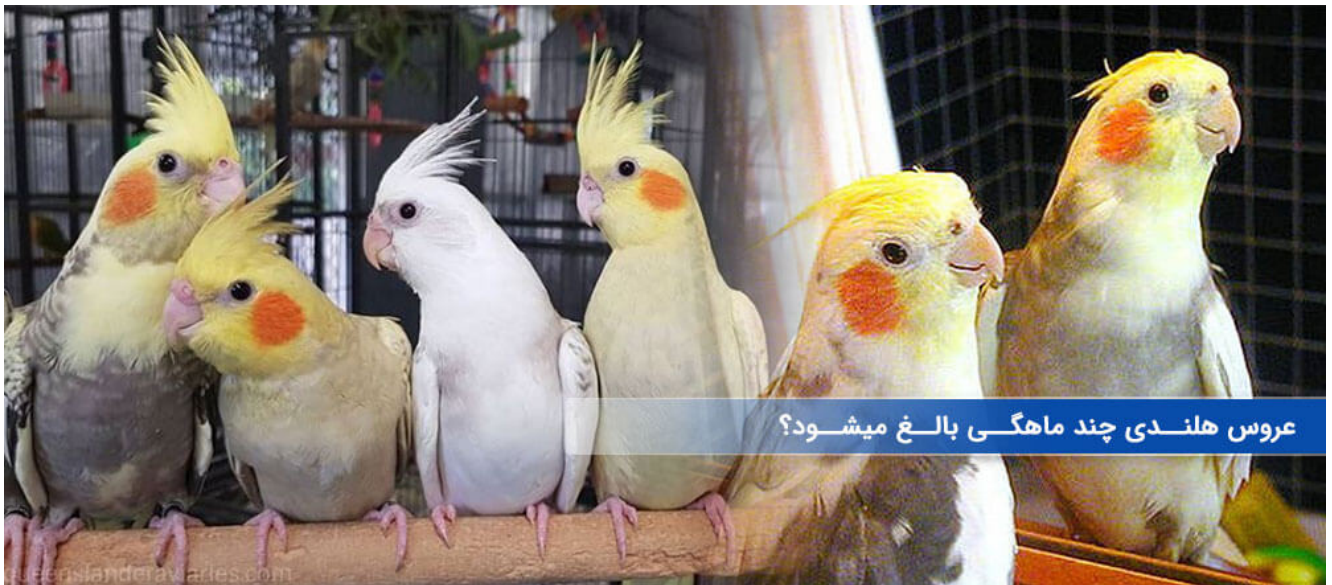
عروس هلندی چند ماهگی بالغ میشود

عروس های هلندی در سن 18 ماهگی به سن بلوغ می رسند و قادر به جفت گیری و تولید مثل خواهند بود. اگر چه که در سن 5 الی 6 ماهگی نیز می توان نشانه هایی از بلوغ جنسی را در آنها یافت، ولی برای تولید تخم هایی نطفه دار و جوجه کشی از آنها باید عروس هلندی هایی به سن 18 ماهگی برسند.