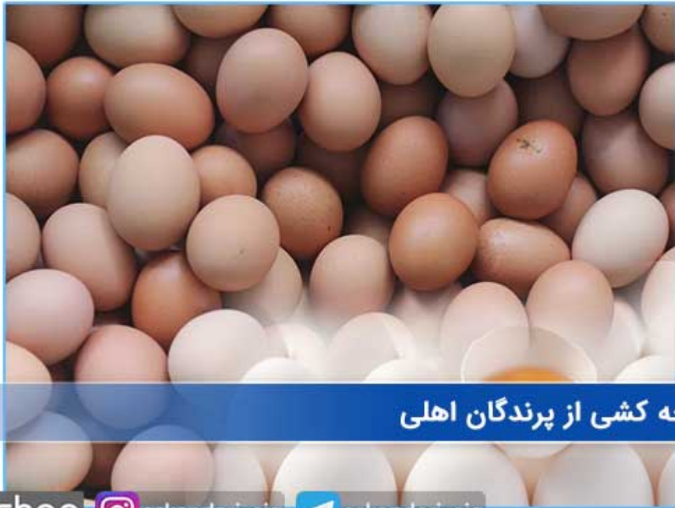
جوجه کشی از پرندگان اهلی

EIG shop | eskandari_eig | eskandari_eig