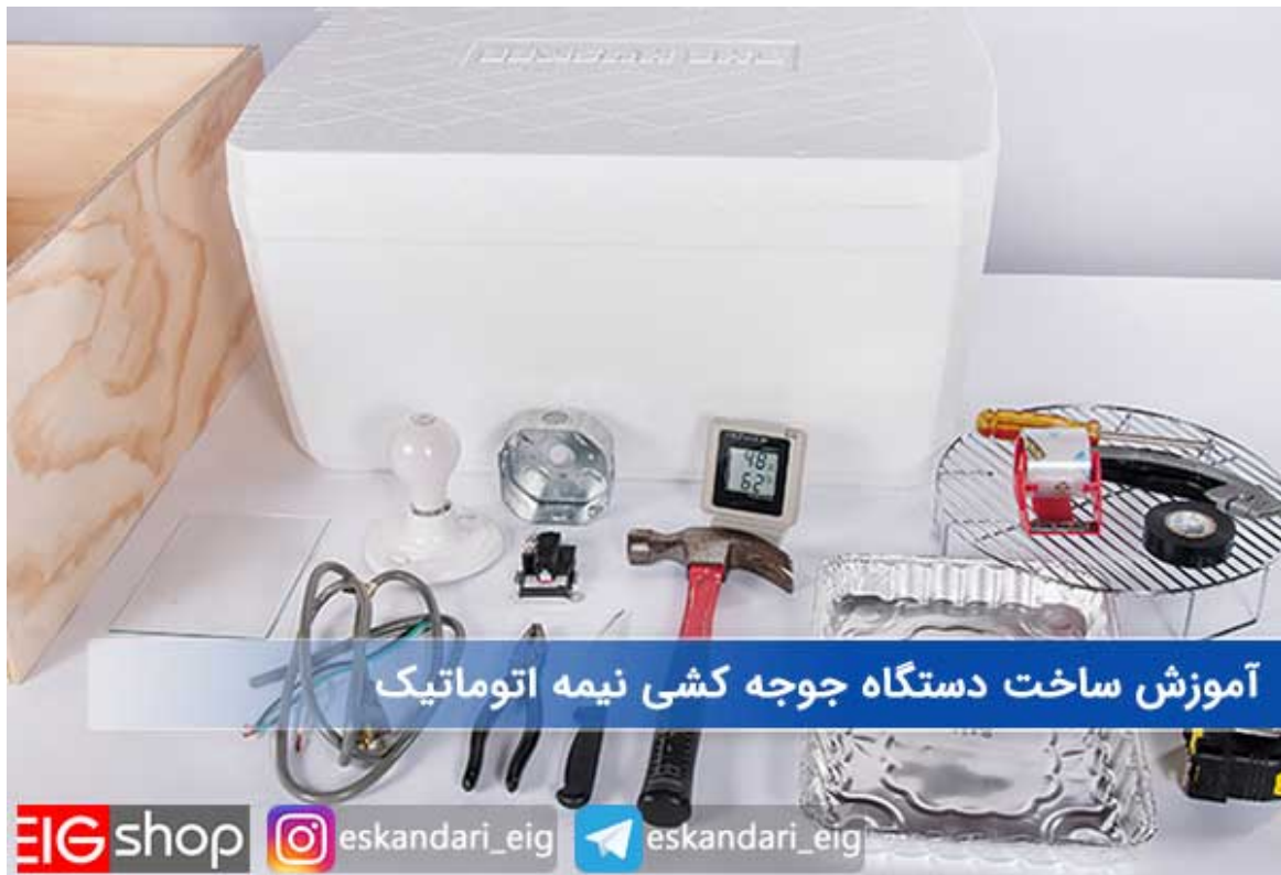
آموزش ساخت ماشین جوجه کشی نیمه اتوماتیک

اگر می خواهید دستگاه جوجه کشی بسیار ارزان بسازید ، می توانید از بدنه یخچال به عنوان محفظه دستگاه جوجه کشی استفاده کنید. بدنه یخچال به دلیل استفاده از پشم شیشه در ساخت آن عایق بسیار مناسبی برای دما است.