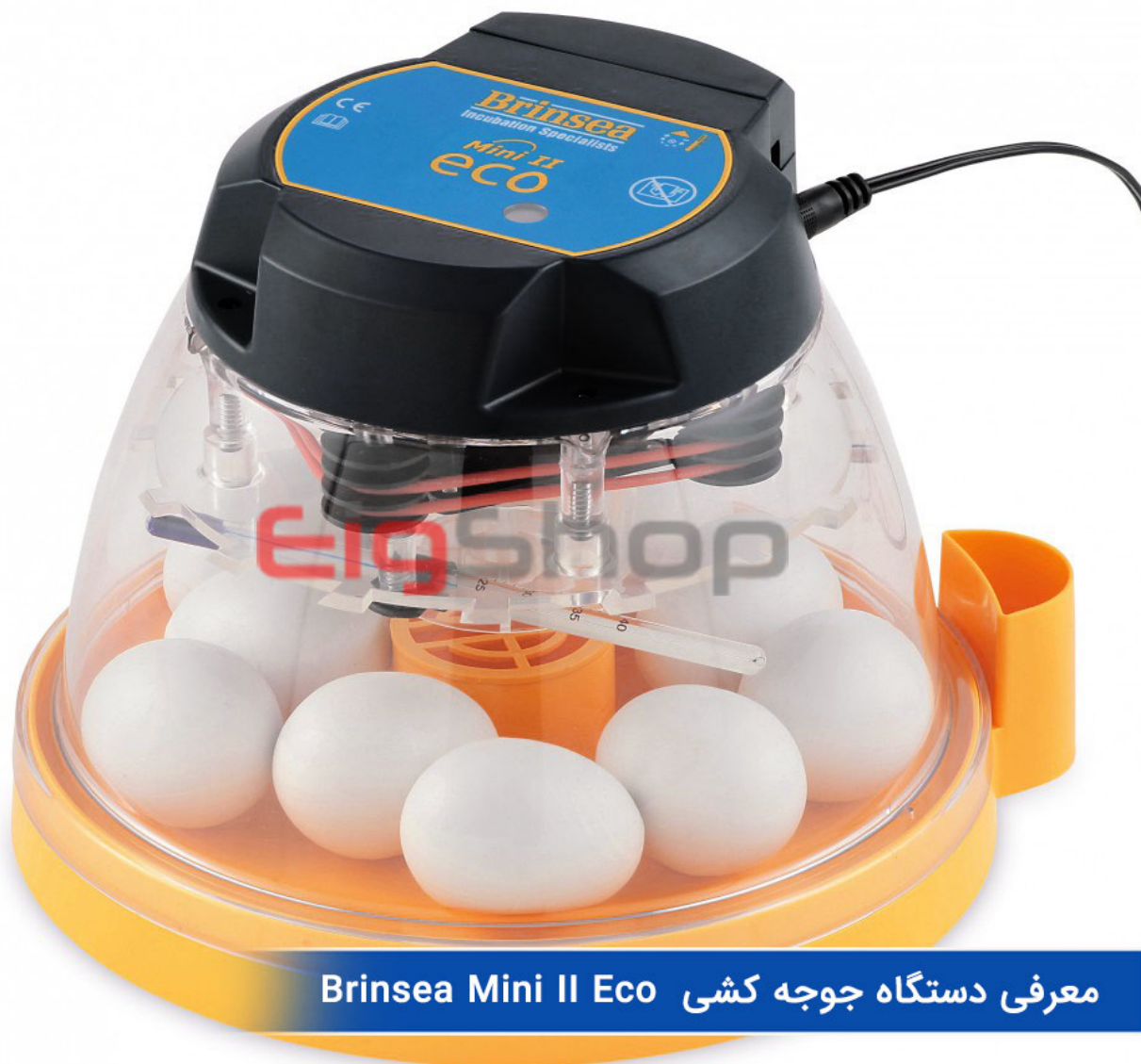
معرفی دستگاه جوجه کشی Brinsea Mini II Eco