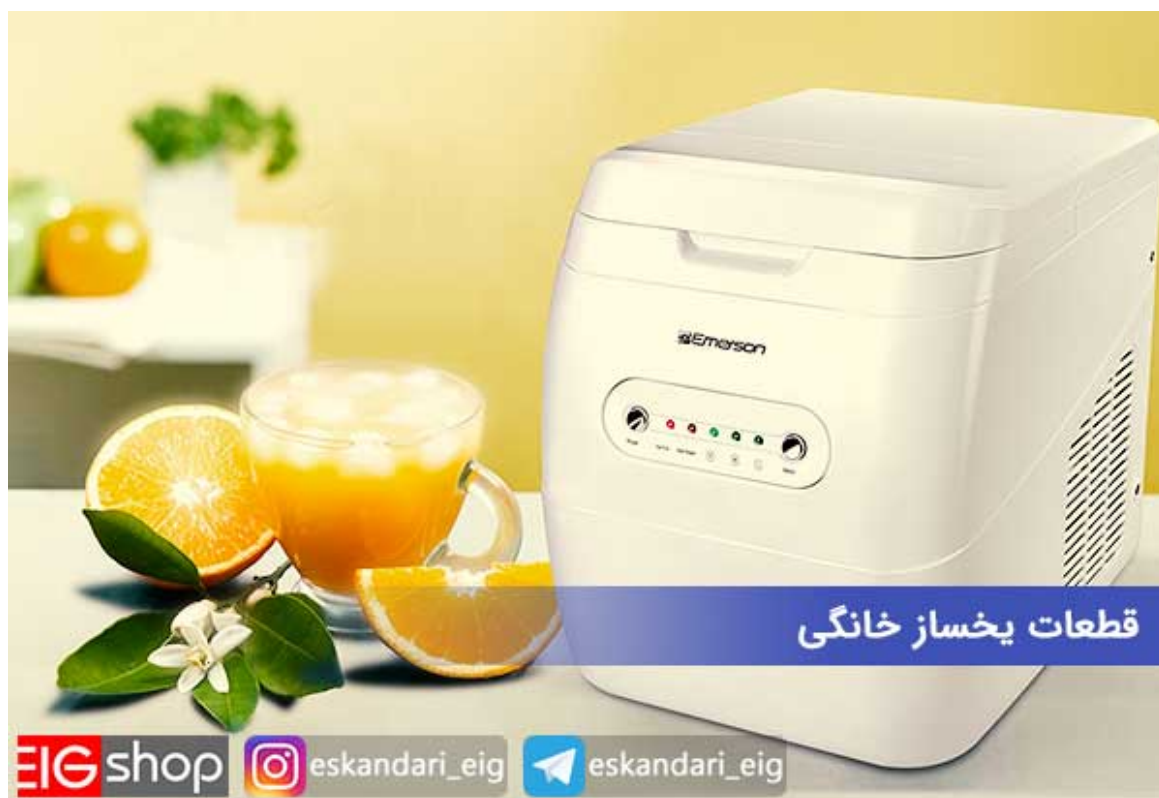
قطعات یخساز خانگی

قطعات یخساز خانگی : یخسازها تجهیزات هستند که از آن‌ها برای تولید یخ مصرفی منازل مسکونی ، رستوران‌ها ، فست‌فودها ، ورزشگاه‌ها و سایر مکان‌ها استفاده می‌شود. این دستگاه‌های یخ‌ساز معمولاً دارای ابعاد کوچکی هستند و ظرفیت پایین برای تولید یخ دارند. نوع دیگر یخ‌سازها ، یخ‌سازهای صنعتی هستند که ابعاد بزرگتر و ظرفیت بیشتری برای تولید یخ دارند که به آن‌ها کارخانه‌های یخ‌سازی نیز گفته می‌شود. اگر شما نیز جزء افرادی هستید که قصد خرید یخ‌ساز خانگی یا رستورانی را دارید ، برای آشنایی با تجهیزات توصیه می‌کنیم که این مقاله را با دقت بخوانید.