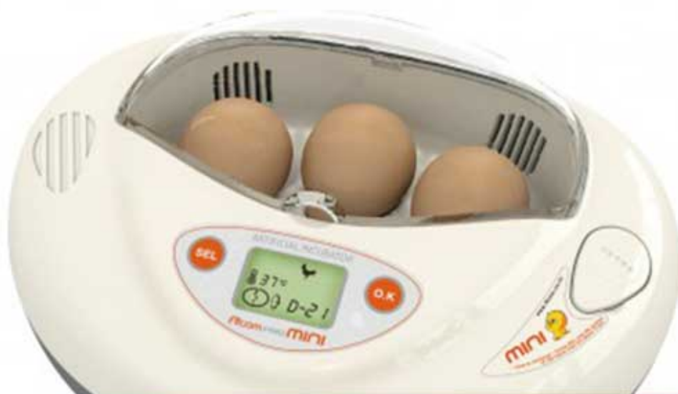
معرفی دستگاه جوجه کشی آرکام R-Com PRO Mini

چرخش ، دما ، رطوبت و تمامی موارد مورد نیاز تماما به صورت اتوماتیک صورت میگیرد و شما تنها نیاز از به صورت دوره ای به دستگاه جوجه کشی R-Com PRO Mini آب اضافه نمایید. حتی سیستم هچر نیز به صورت اتوماتیک در زمان مورد نیاز فعال میشود.