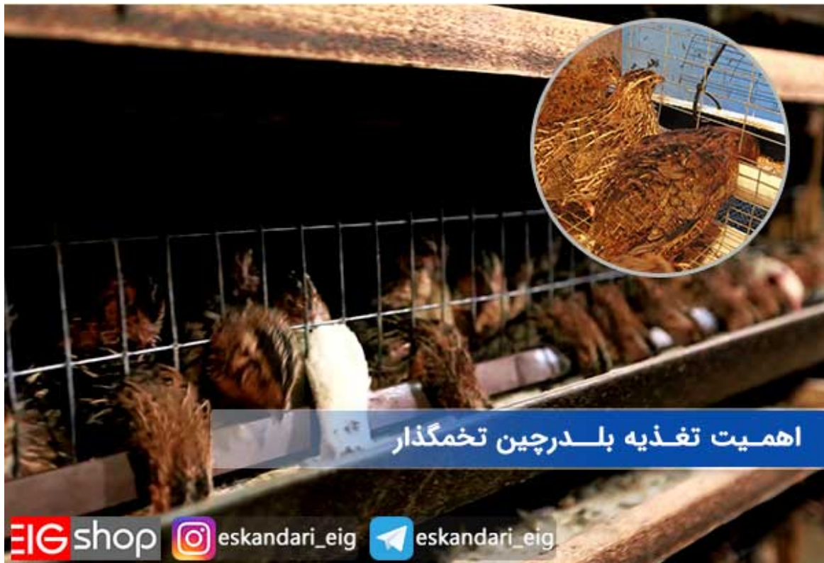
اهمیت تغذیه بلدرچین تخمگذار

کیفیت تغذیه پرنده بر میزان تخم گذاری او تاثیر بسزایی دارد، سعی کنید غذای بلدرچین ها را از مراکز معتبر تهیه کنید. تا از کیفیت آن مطمئن باشید. دان های مصرفی بلدرچین را خودتان نیز میتوانید تهیه کنید البته این کار نیاز به تخصص دارد، اگر متخصص آشنا دارید می توانید فرمولاسیون دان بلدرچین را از او تهیه نمایید.