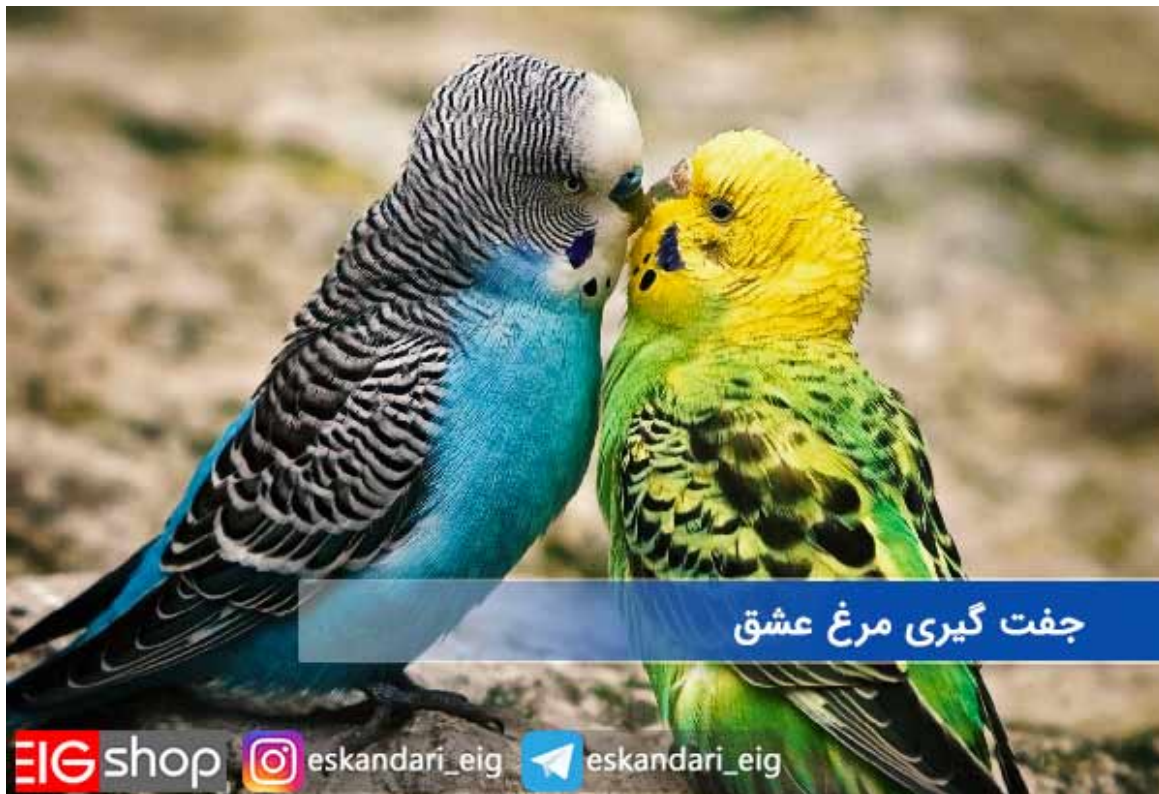
جفت گیری مرغ عشق