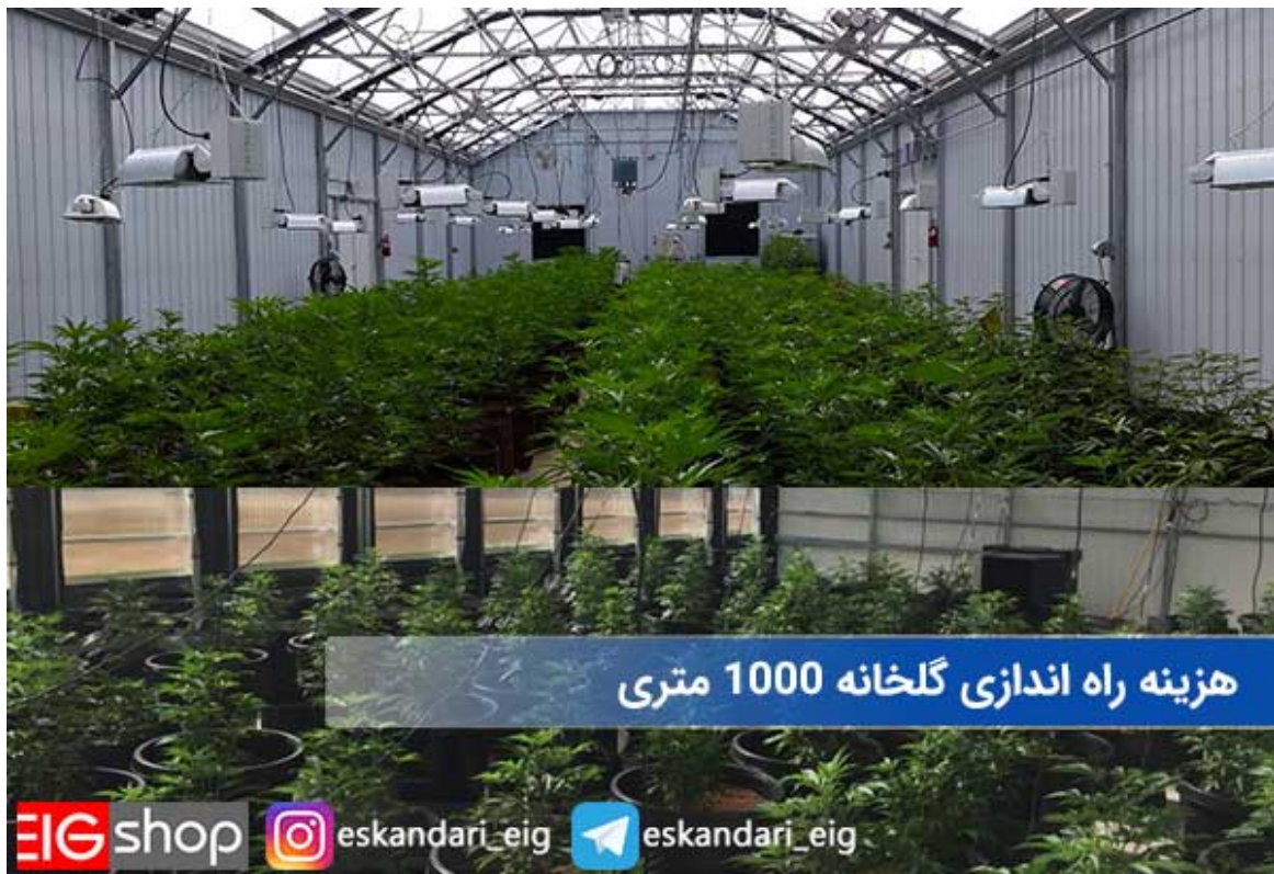
هزینه راه اندازی گلخانه 1000 متری

هزینه راه اندازی گلخانه بسته به مکان ، تجهیزات و تجربه شخص می تواند بسیار متغیر باشد. کشاورزی امری کاملا پسندیده و زیباست و در هر زمان و هر مکانی نیز سود آوری دارد، از زمانی که انسان قادر به کاشت و برداشت محصول بوده همواره محصولات کشاورزی دارای ارزش بوده و مشتریان زیادی برای آن وجود داشته است، هم اکنون نیز در بسیاری از کشور ها و من جمله خود ایران کشاورزی بسیار پر رونق بوده و منبع درآمد مهمی برای بسیاری از خانواده ها محسوب می شود. اما از زمانی که کره زمین دچار گرمایش شده و همگی با مشکل کم آبی مواجه شده ایم، کشاورزی نیز با مشکلات زیادی رو به رو شده و کشاورزان را با استرس های زیادی مواجه ساخته است.